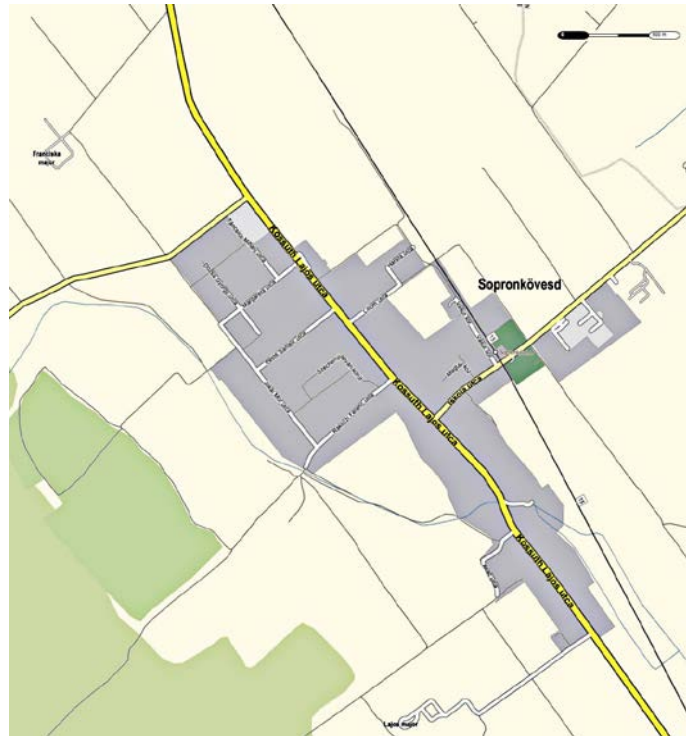
Sopronkövesd település térségi elhelyezkedése