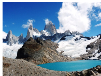
Cerro Fitz Roy, Santa Cruz, (Patagónia), Argentína